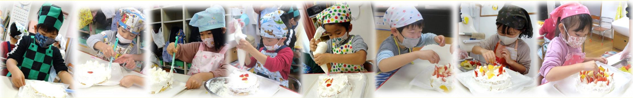
⑤そのうえにスポンジをのせて、またクリームぬって… ⑥さいごにかざりつけ！なまクリームをしぼって、くだものをのせて、飾りをのせて、できあがり★