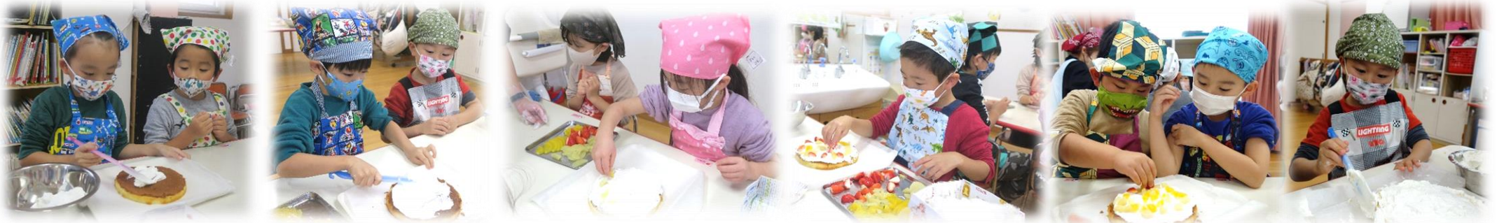
①かさねてあるスポンジを広げて ②やいためんを上にしてクリームをぬって… ③くだものをのせて… ④クリームをまたのせて…クリームをととのえて…

トッピングする子、慎重にくだものを立てて飾る子 etc. 本当に楽しそうで、にじ組 さんみたいな、「元気なケーキ」「かわいいケーキ」ができました。どれも最高！！ みんな、嬉しそうに食べていました 🍪 ぜひ、お家でもお話を聞いてみて下さい。