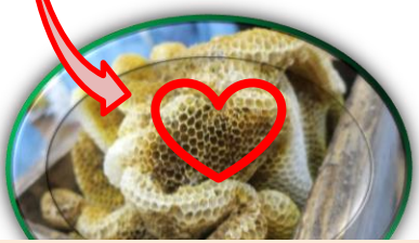
ここが、ハートにみえたそうです！

※今回いただいた蜂の巣は、もうハチが入っていませんが、どこかでハチの巣を見つけても、絶対に触ったり近づいたりしてはいけないことも、お話しています(^^)